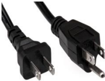
USA plug 110-120 can also be used in JAPAN USA bouchon 110-120 peut également être utilisé au Japon.