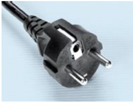
EURO plug 220-240 volt EURO prise 220-240 volts