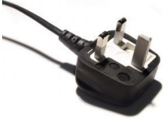
UK plug 220-240 volt Prise UK 220-240 volts

Avant utilisation, vérifier votre fiche pour s'assurer qu'il est la tension appropriée pour votre pays.